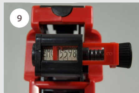
9 Táhlým pohybem (vysunutím a zasunutím) číselníku, nastavíme pozici a kolečkem určíme číslici, která má být natištěna na etiketě.