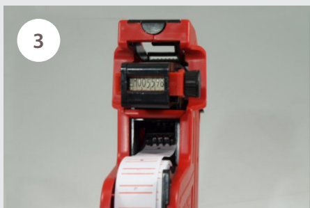
3 Štítky provedeme středem kleští viz. obrázek