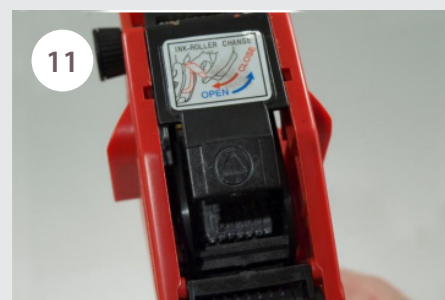
11 Místo pro výměnu náplně