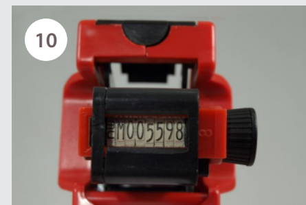
10 Číselník zasuneme