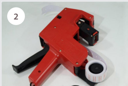
2 Půlkulatým tahem nahoru otevřeme zásobník pro výměnu etiketovacích štítků