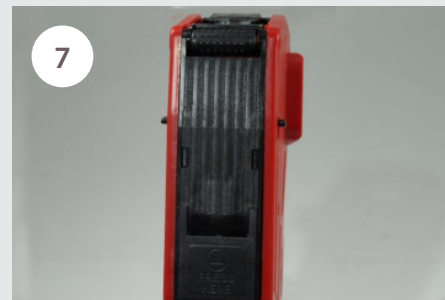
7 Uzavřeme krycí lištu