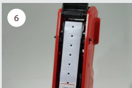
6 Etiketovací pásku protáhneme směrem k rukojeti viz. obrázek