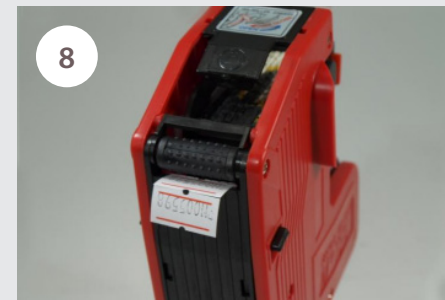
8 Po stisknutí rukojetí, nám vyjede natištěná etiketa.