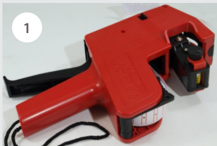
1 Původní stav kleští